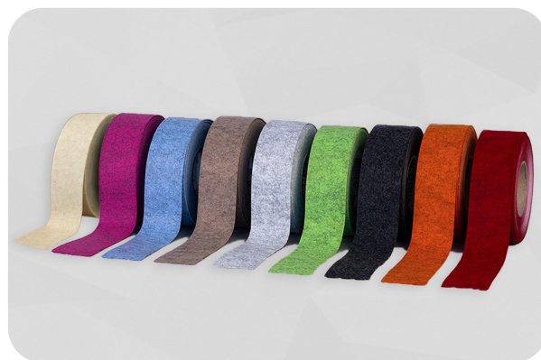
Cintas de fieltro soni VLD