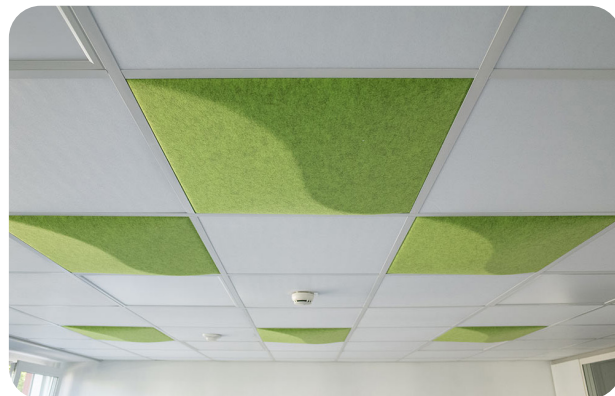
Ex: panneaux soni COLOR Design YinYang posés dans un système de plafonds