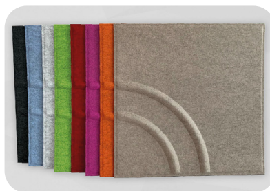
soni COLOR Design Wave